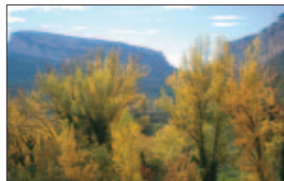
Vista del fondo del valle, con Peña de la Virgen y Peñarrubia.

Sin duda, si algo destaca en Pitarque es el Nacimiento del Río Pitarque , conocido por los lugareños tradicionalmente como "el ojo de la fuente". Está ubicado al fondo del valle, a unos 5 km del pueblo, protegido por dos macizos montañosos, la Peña