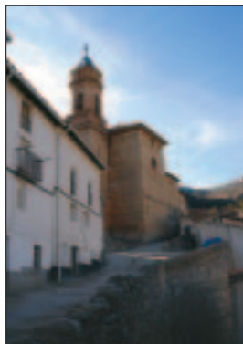
Iglesia de Pitarque.

Se sabe que el primer asentamiento fue en la zona llamada Pitarquejo, y que los habitantes eran iberos que, más tarde, con la necesidad de protegerse, se internaron en lo que hoy en día es el pueblo de Pitarque. Fue también un asentamiento árabe puesto que la actual iglesia está ubicada sobre lo que fue el castillo árabe.