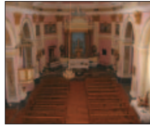
Iglesia de Santa María la Mayor.

Destaca de su caserío la Iglesia de Santa María la Mayor , neoclásica de principios del siglo XIX. Realizada en mampostería de una sola nave, cabecera poligonal y cubierta de bóveda de cañón con lunetos, tiene una sola torre situada en el ángulo del Evangelio de la zona de los pies, combina ladrillo y piedra sillar. Fue construida por la Orden de San Juan.