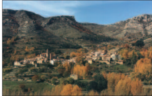
Vista panorámica de Pitarque.

Pitarque, localidad situada en la Comarca del Maestrazgo, se emplaza en mitad del valle del Río Pitarque a 998 m sobre el nivel del mar.