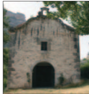
Ermita de la Virgen de la Peña.

Pero quizás la Ermita de la Virgen de la Peña , de planta rectangular y mampostería encalada; ubicada en mitad del camino de acceso al nacimiento; sea uno de los lugares más frecuentados por los pitarquinos; ya que los hechos que allí sucedieron hacen de esta ermita un lugar mágico y encantador al que los lugareños acuden a rezar y a pedir milagros a la Virgen; de ahí que se tenga más devoción a esta Virgen que a cualquier otra.