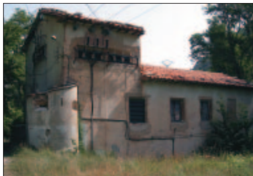
Central eléctrica de la cabecera del río Pitarque.

También en 1927 fue sabotada la central eléctrica situada en la cabecera del río Pitarque. Esta central funcionó desde entonces proporcionando alumbrado público y privado a 43 municipios. En 1965 fue absorbida por la empresa "Eléctricas Reunidas de Zaragoza".