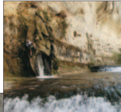
Nacimiento del Río Pitarque.

Si visitas el Nacimiento recuerda que se trata de un paraje que ha permanecido así durante siglos y queremos que permanezca muchos más de la misma manera. Ayúdanos a conservarlo, sé respetuoso y no tires basura.